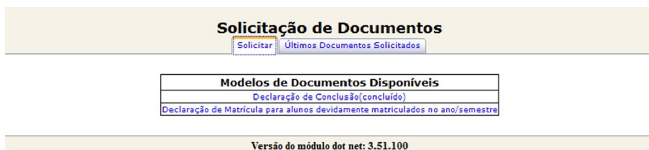
Figura 2 – Modelos de Documentos

Na página de solicitação de documento o aluno deverá clicar no link com o nome do tipo de documento desejado (fig. 2).