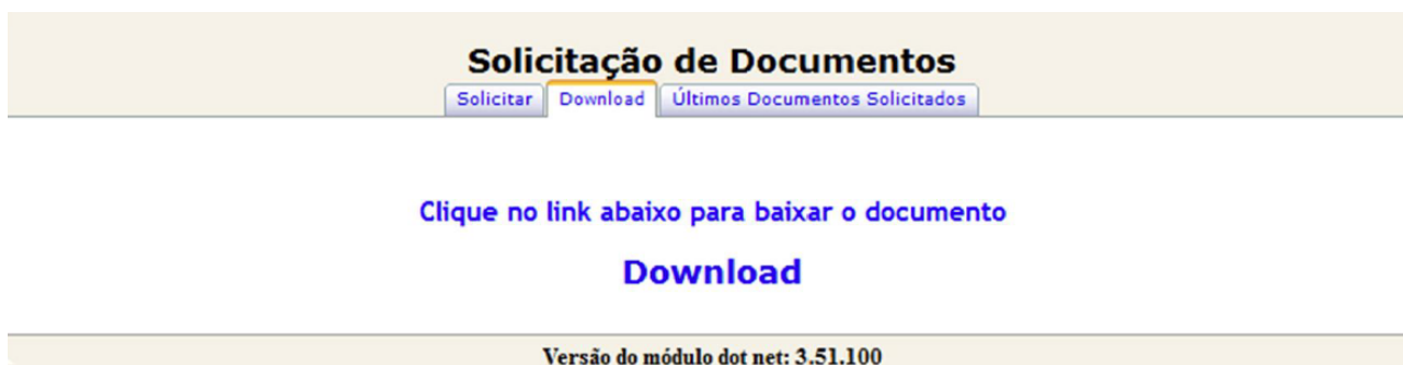
Figura 3 – Documento Gerado

Após isso, se a situação e os dados cadastrais do aluno estiverem corretos e atualizados, um documento PDF será gerado e aparecerá um link para download do mesmo (fig. 3).