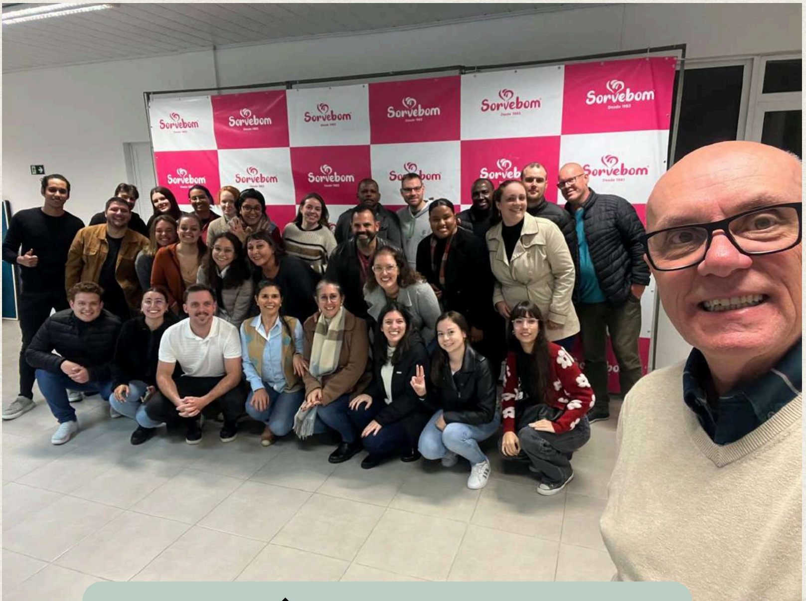
VISITA TÉCNICA SORVEBOM