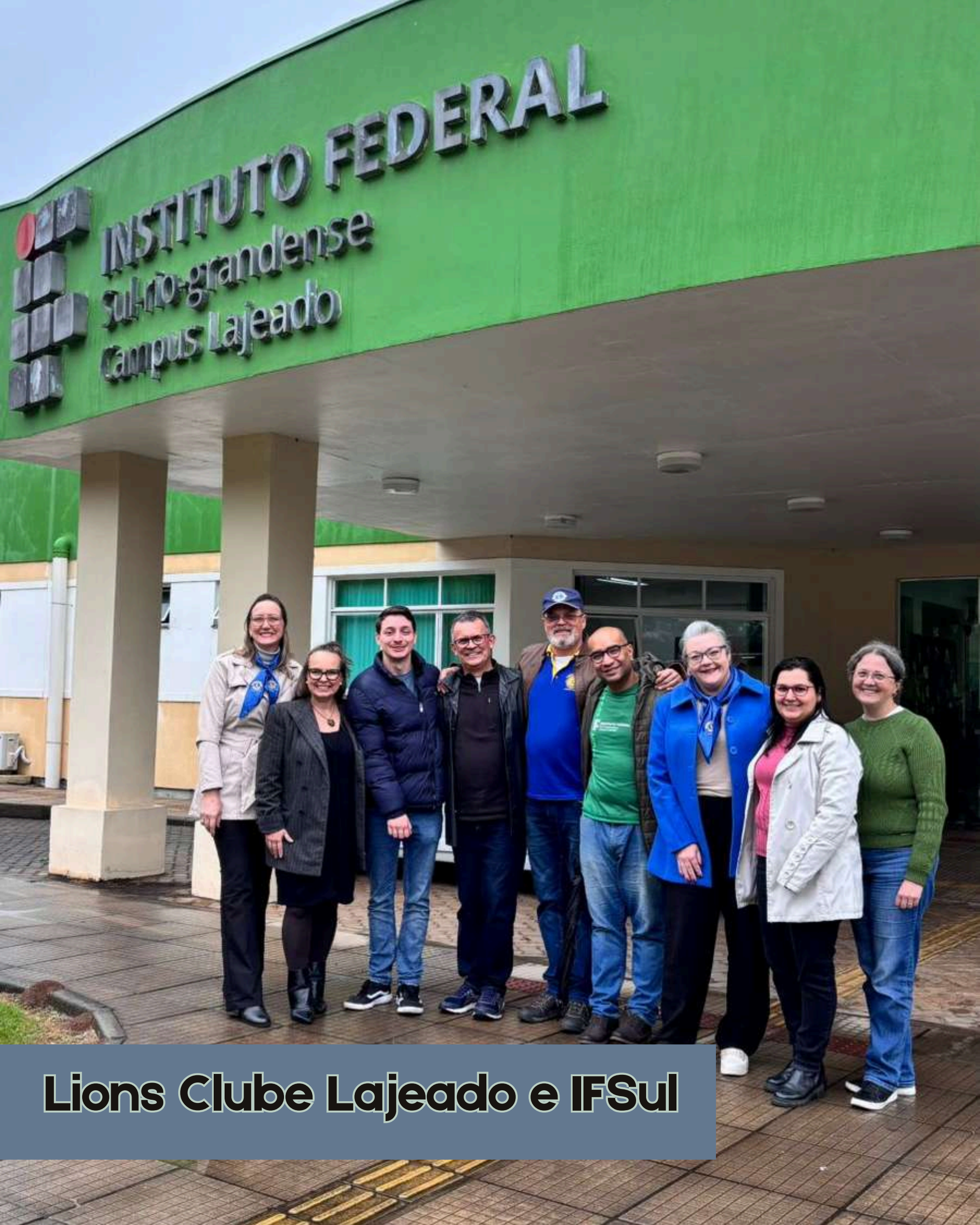
Lions Clube Lajeado e IF Sul